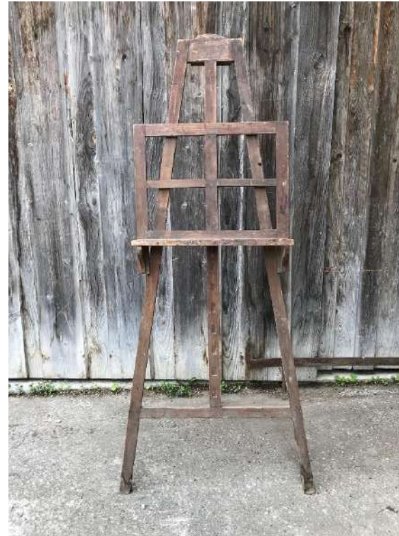
„Staffelei“ für zum Beispiel Sitzplan / Gästebuch etc.

Uhrzeiten und Programm muss selbst beschriftet werden – Kreidestift bitte nicht vergessen!