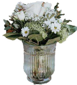
12 x „Klassik“