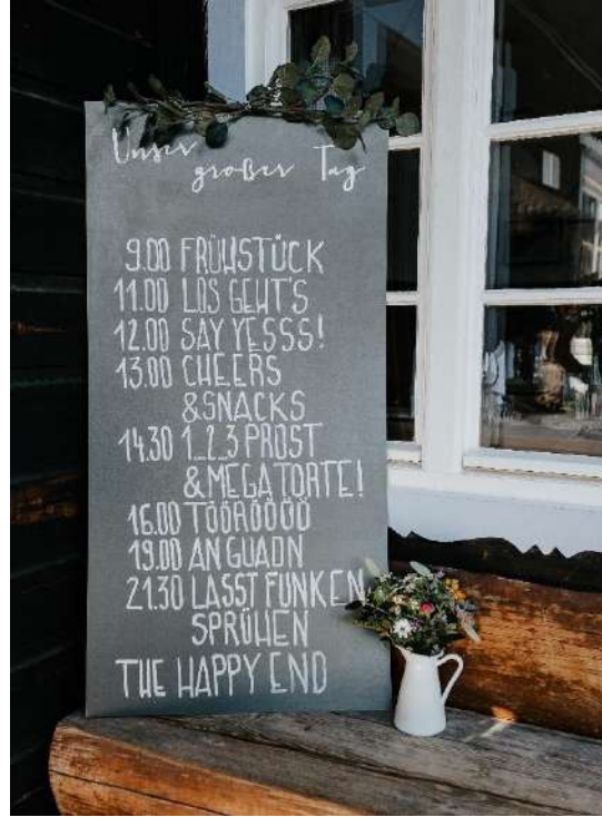
„Unser großer Tag“ Ablaufplan Schild

Namen und Datum muss selbst beschriftet werden - Kreidestift bitte nicht vergessen!