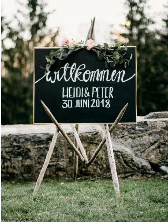
Welcome Schild mit Heumanderl

Namen und Datum muss selbst beschriftet werden - Kreidestift bitte nicht vergessen!