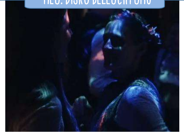
„Disco Beleuchtung“ für Kaminzimmer & Barbereich

Siehe Beleuchtung im Video: https://vimeo.com/299300049