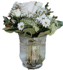
12 x „Klassik“