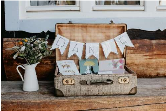
Cards Koffer für eure Glückwunschkarten

Hier ist die Danke Girlande und ein Jute Tusch als Unterlage für die Glückwunschkarten enthalten.