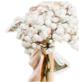
16 x Schleierkraut Buschel für Spalierstöcke