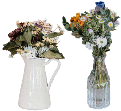
12 x „Almerisch“

„Bestellt die Blumen über uns, dann übernehmen wir den Transport & Kühlung vor Ort“