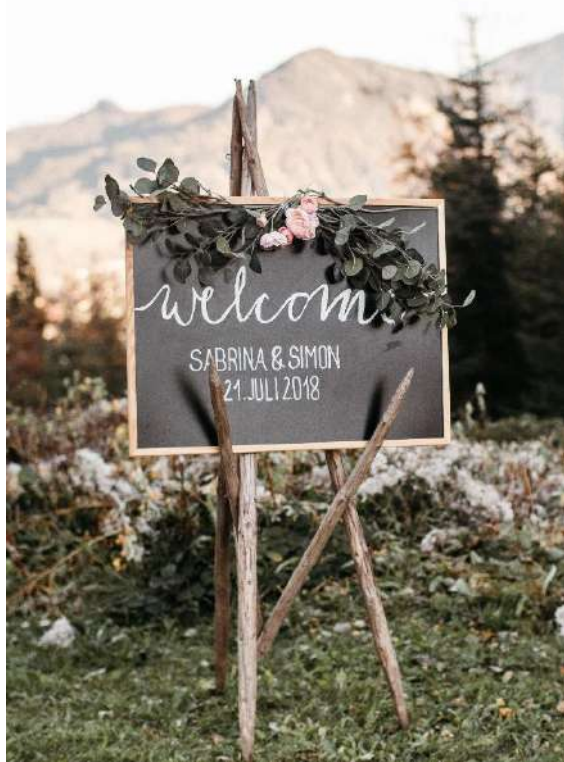
Welcome Schild mit Heumanderl

Namen und Datum muss selbst beschriftet werden - Kreidestift bitte nicht vergessen!