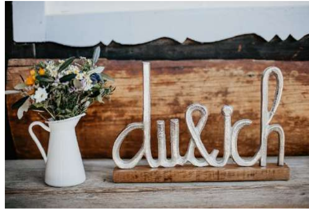
„du & ich“ Schild für Altar / Hochzeitstisch

Hier ist die Danke Girlande und ein Jute Tusch als Unterlage für die Glückwunschkarten enthalten.