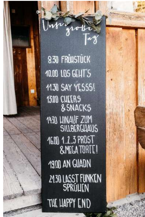
„Unser großer Tag“ Ablaufplan Schild

Namen und Datum muss selbst beschriftet werden - Kreidestift bitte nicht vergessen!